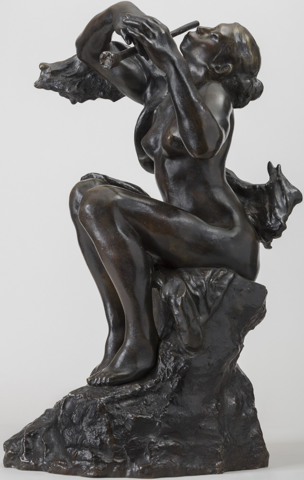
Camille Claudel, La Joueuse de flûte , vers 1905, bronze © Marco Illuminati