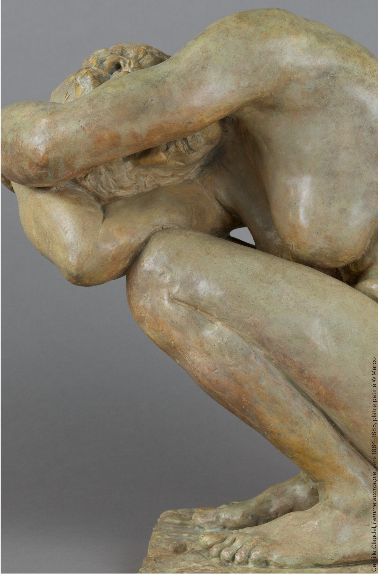
Camille Claudel, Femme accroupie, vers 1884-1885, plâtre patiné